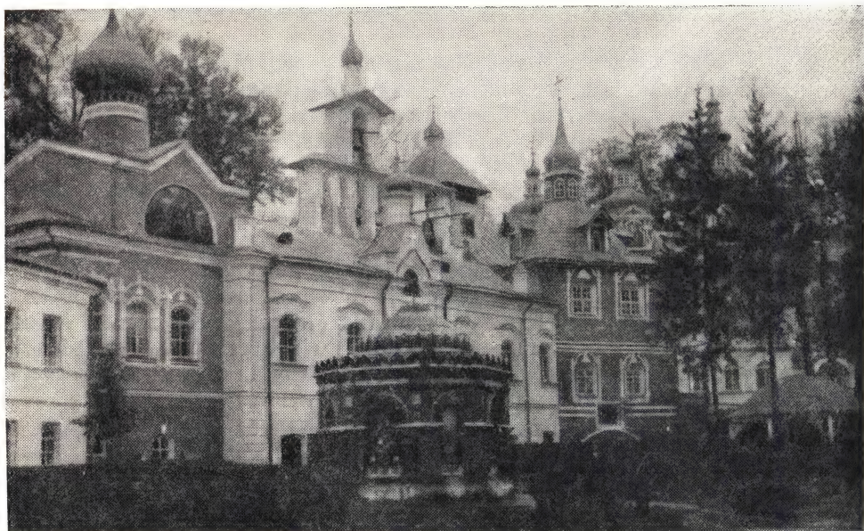
ВВЕДЕНСКИЙ ХРАМ. СРЕТЕНСКИЙ ХРАМ. РИЗНИЦА

щееся из храма пение хора, да отрадный, успокоительный шум дубравы на Святой горе.